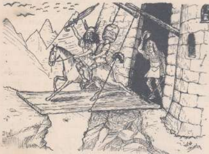
Sourteroun en dighen au counsergo che s'en anouvou ai limassa

Apré 30 ans de poultica, Charlemagne, traenssat per li assurensa souciali e lu agassin, aùghet lu pen nickelat, senche fa che coura la sieù fin approucié, noun poungue s'escapa e deveissé lou sieù billart. Lou trône, en pitchpin galvanisat e chassa d'aiga courenta,